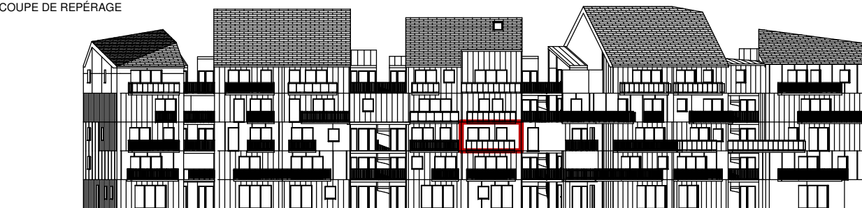
COUPE DE REPÉRAGE