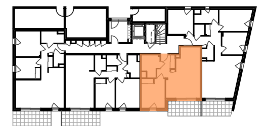
REZ DE CHAUSSEE